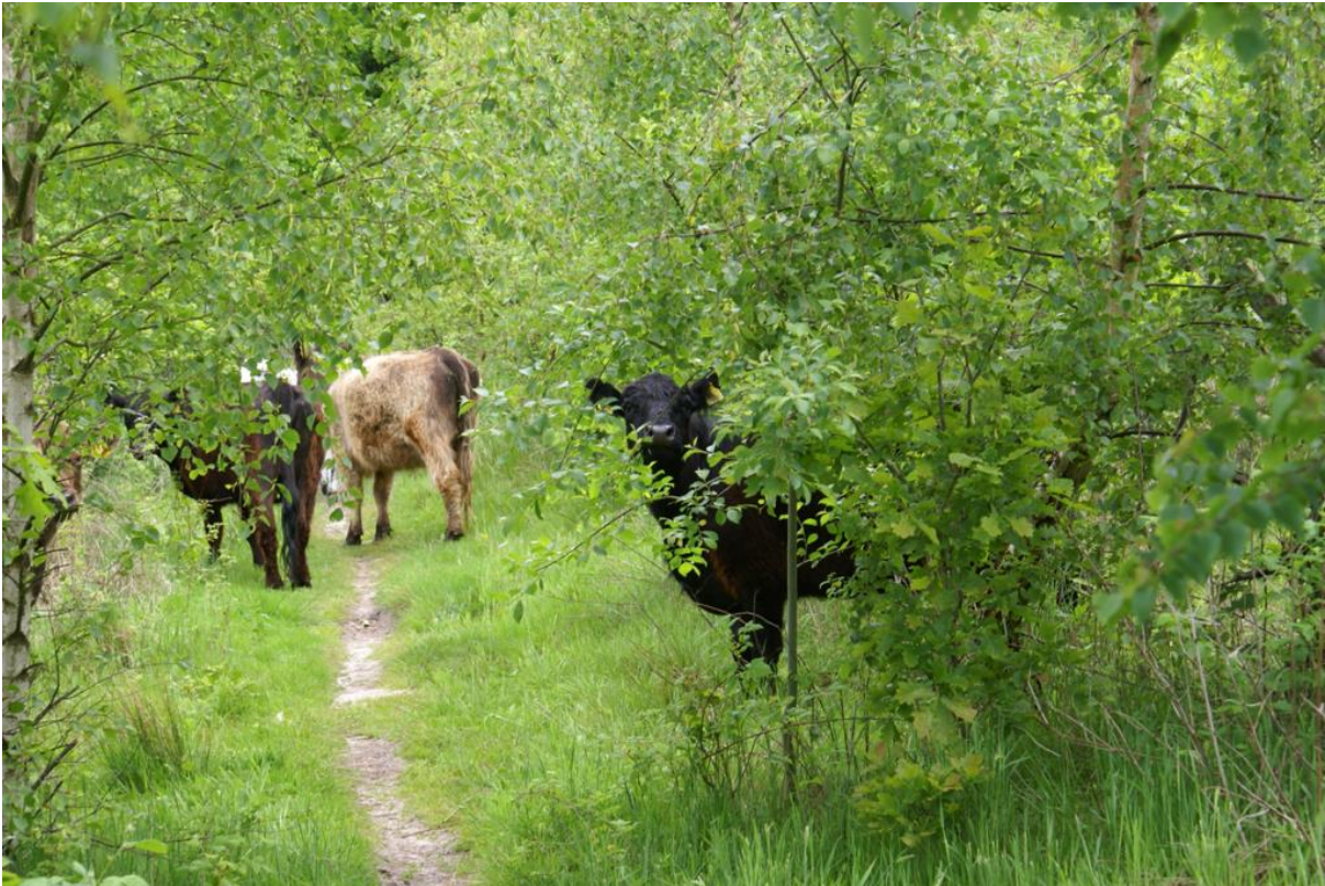
Figur 2 Galloway i stormfald fra 2005. Pressemeldelse 2021.